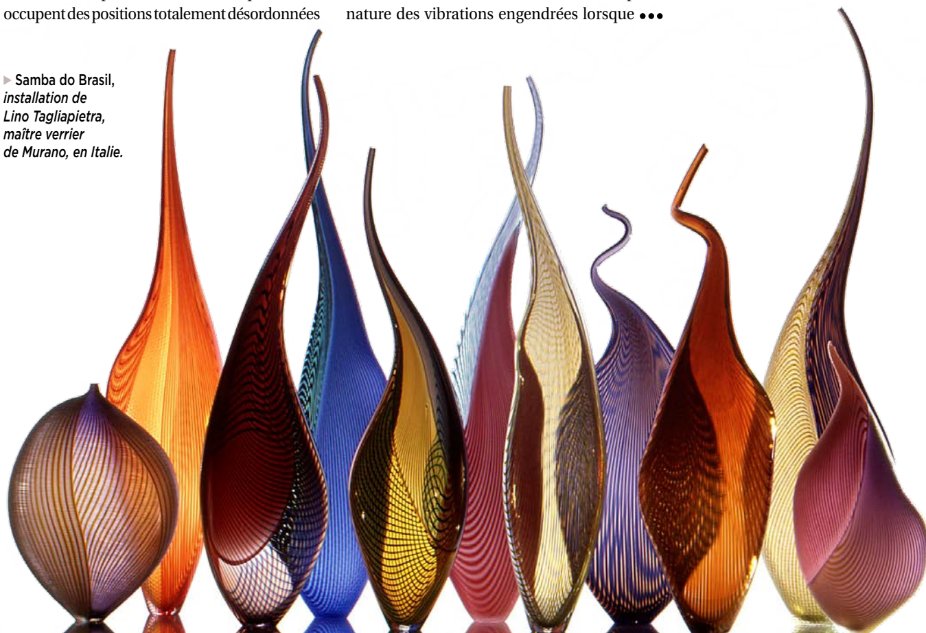
► Samba do Brasil, installation de Lino Tagliapietra, maître verrier de Murano, en Italie.

Cette situation fait écho à la phrase de Tolstoï : « Toutes les familles heureuses se ressemblent, mais chaque famille malheureuse l'est à sa façon. » Bien que l'on puisse construire ces structures facilement, il est très difficile d'expliquer les propriétés microscopiques des différents empilements désordonnés, et de décrire de manière simple la nature des vibrations engendrées lorsque ●●●